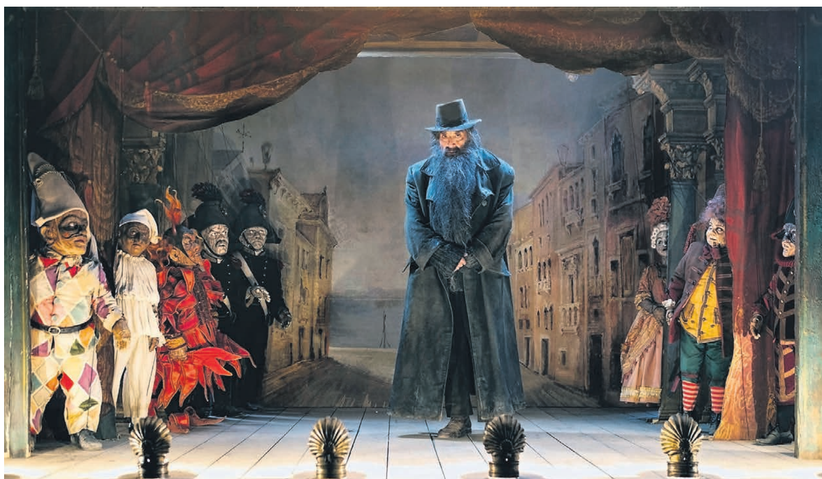
Кукловод Манджафуоко (собрать Карабаса-Барабаса) выглядит не страшно, чего нельзя сказать о других подробностях фильма

Начинается история вполне знакомо. Столяр Джеппетто (Роберто Бенини) очень, очень беден. Бедны и все остальные жители его родного городка, поэтому никто не заказывает никаких работ по дереву, и Джеппетто, чтобы получить тарелку супа и краюху хлеба, приходится рассчитывать только на доброту соседей. Когда же в город приезжает странствующий театр марионеток, ему приходится в голову идея — сделать куклу,