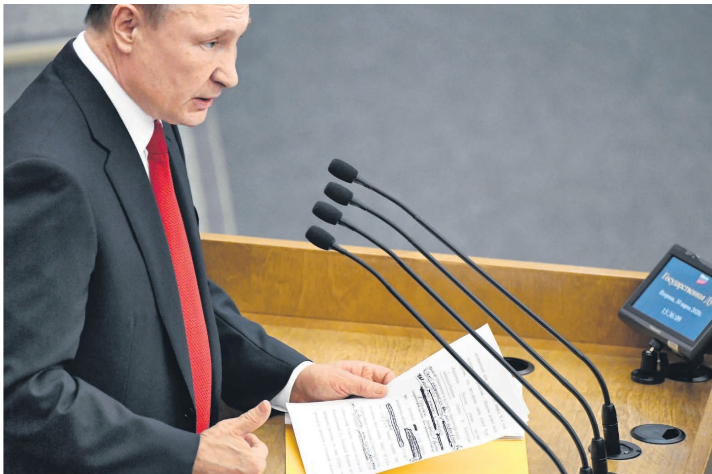
Владимир Путин энергично работал над своим текстом.

— Вопрос-то на самом деле стоит не о нем, а о нас... — читала Валентина Терешкова без особого, впрочем, вдохновения, и кто-то, наверное, уже даже жалел, что текст произносит именно она. — О гражданах России и ее будущем. А если так, то зачем крутить и мудрить? Зачем гордить какие-то искусственные конструкции? Надо все честно, открыто и публично рассмотреть. Или вообще убрать ограничение по числу президентских сроков в Конституции. Или, если этого потребует ситуация и, самое главное, если этого захотят люди, заложить в законе возможность для действующего президента вновь избираться на эту должность, уже