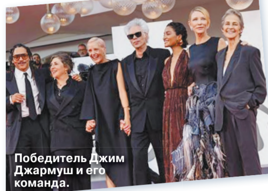
Победитель Джим Джармуш и его команда.

Венецианский кинофестиваль завершился победой Джима Джармуша