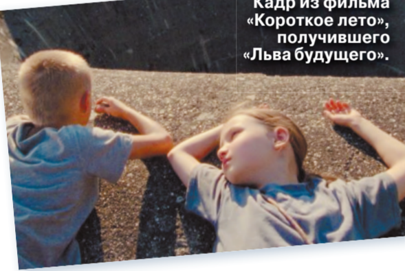
Кадр из фильма «Короткое лето», получившего «Льва будущего».

В программе «Дни Венеции» приз зрительницы получила россиянка из Амстердама.