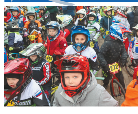
5 и 6 сентября на велодроме «Маринский» принимали байкеров-экстремалов.

показать себя и посмотреть на других собравшихся экстремалы со всей страны.