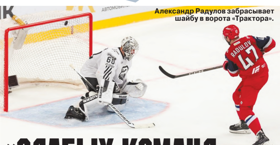
Александр Радулов забрасывает шайбу в ворота «Трактора».

Вот и дождались отечественные любители хоккея старта нового хоккейного сезона