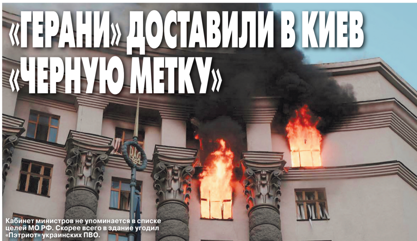
Кабинет министров не упоминается в списке целей МО РФ. Скорее всего в здании угодил «Патриот» украинских ПВО.